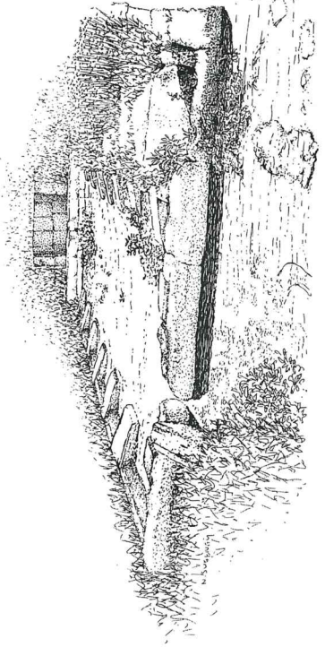
St-Bris-des-Bois - Source lavoir